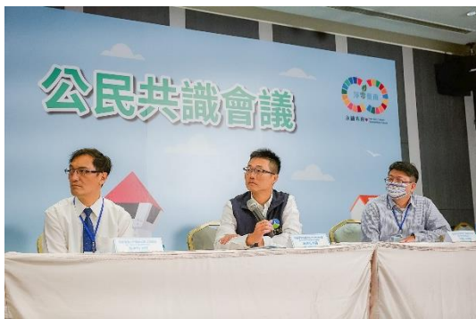
全體共識形成與建議