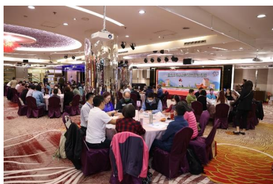
世界咖啡館各組討論