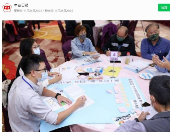
環保局辦理淨零公正轉型世界咖啡館活動，邀專家學者等，探討淨零公正轉型八項議題，希望為政策規劃激盪出更多元的想法。

世界咖啡館凝聚共識 臺南市積極迎接 2050 淨零碳排 奧丁丁新聞 OwlNews