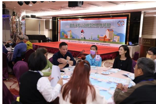
世界咖啡館各組討論