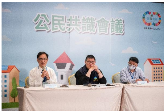
全體共識形成與建議