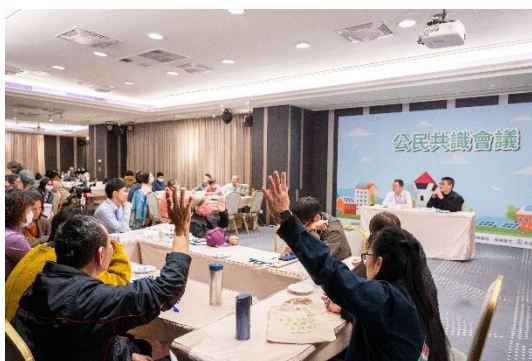
全體共識形成與建議