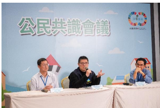
全體共識形成與建議